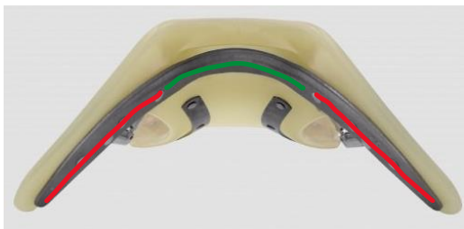
Åben sadelbom - "U formet"

Når der ændres på bomvidden på en sadel, er det faktisk kun bomvinklen der ændres, her markeret med rød: