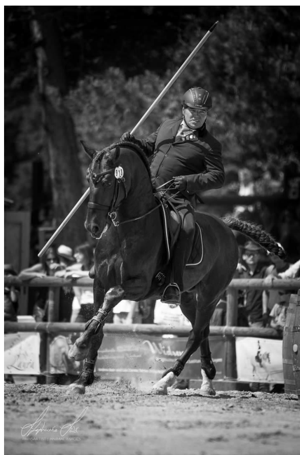
World Championship