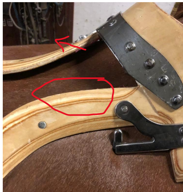
Her ses en sadelbom med en smal talje på en bred ryg. Læg mærke til hvordan sadelbommen kun hviler på underkanten, gaber i hele toppen, samt hvordan stigebøjleophænget står vinklet ind i hesten.

Sadlen vil ligge "ovenpå" og med et forøget tryk på dette punkt: